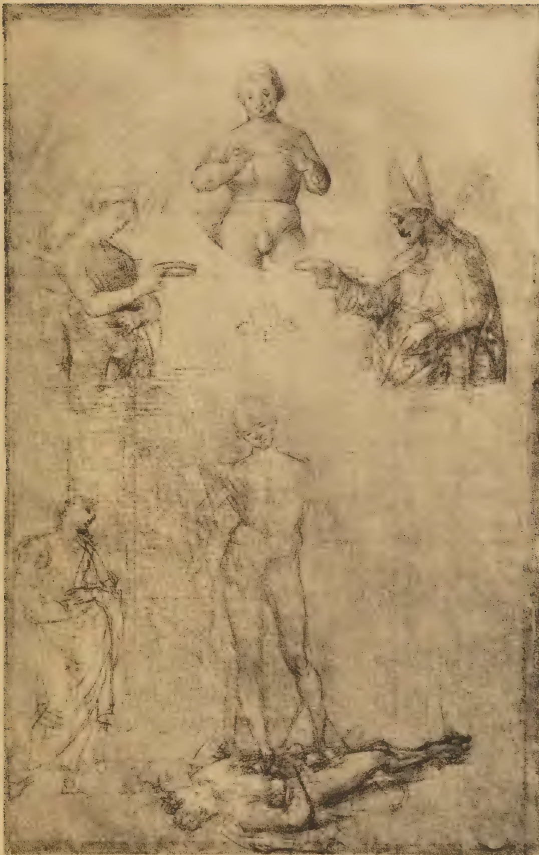
Dessin pour le S t Nicolas da Tolentino